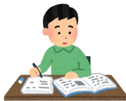
ご自宅での通信課題 (全6回提出)